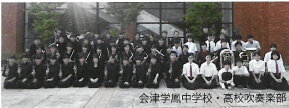
会津学鳳中学校・高校吹奏楽部