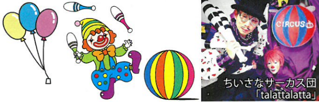
ちいさなサーカス団 「talattalatta」