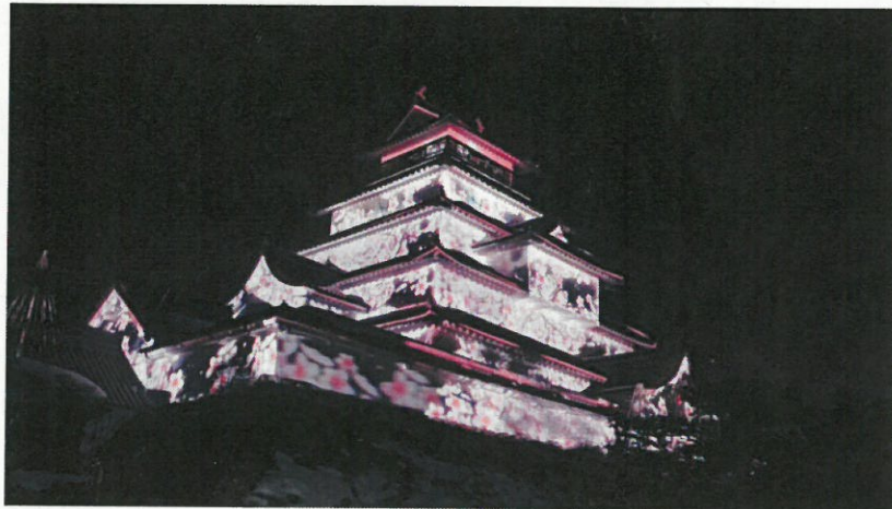
鶴ヶ城プロジェクションマッピング はるか (平成25年3月)