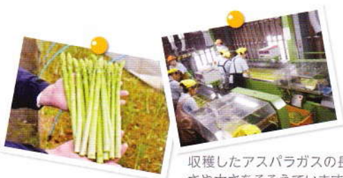
収穫したアスパラガスの長さや太さをそろえています。これがお店へ出荷され、私たちの食卓へと届きます。