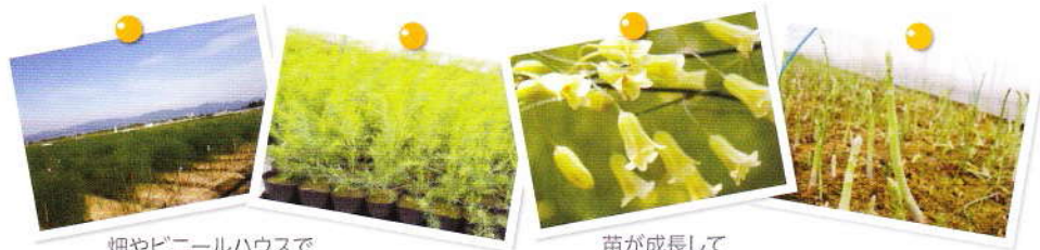
畑やビニールハウスで苗が育ちます(写真はアスパラガス)。