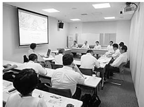
新エネルギー等検討会議の様子