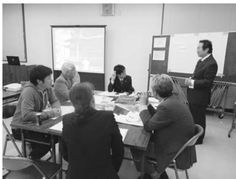
市民ワークショップの様子

「これならできる」「やってみたい」という行動を選んで、できるところから、継続して取り組んでいくことが重要です。