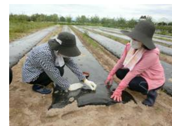
R5の移動学習の様子 ※R5年度は別の会場となります。