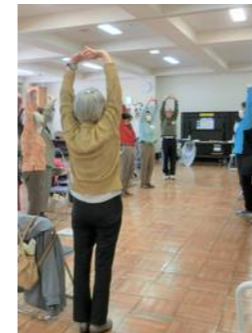
軽体操で体をほくします!