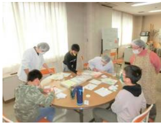
シュガークラフト体験