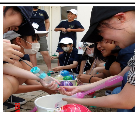
永和地区地域づくり協議会主催の「永和地区夏まつり」のスタッフとして、中学生がボランティアで参加しました。暑い中、水ヨーヨー等の準備、受付やゲーム・出店コーナーで大活躍でした。

小中学校と地域が、パートナーとして連携・協働し、地域全体で子供たちの学びや成長を支える活動をしています。第六中学区では、2学期も地域の方々の協力のもと、様々な取り組みを行いました。