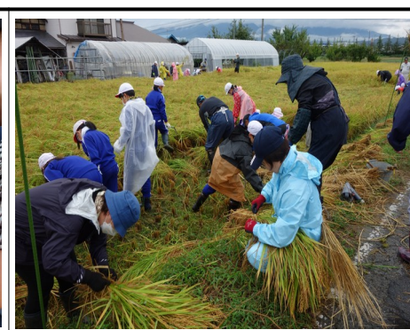
永和小学校の学年行事「稲刈り」です。5月に田植えをし、たわわに実った稲を、全校生・先生・保護者やご家族・地域ボランティアの方々が一緒に力を合わせて、手刈りと稲架掛けの作業をしました。