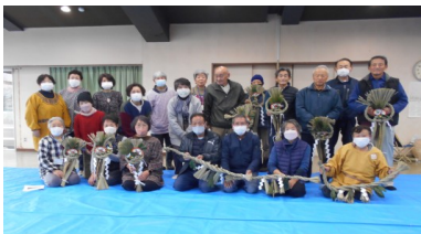
永和ものづくり楽校