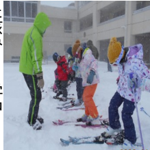
昨年のスキー学習

学校とともに地域全体で子どもたちの学びや成長を支え、学校を核とした地域づくりを目指す取組みです。 現在、1月17日(火)開催予定の、永和小1・2年生「スキー学習」の支援ボランティアを募集中です!