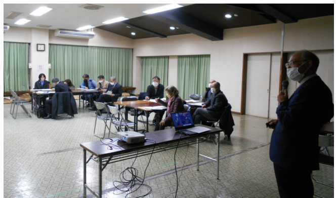
12月協議会では、永和地区の歴史を学習しました。

◆ 地域のみなさま、お気軽に話し合いにまざってみませんか?ご参加をお待ちしております! ◆