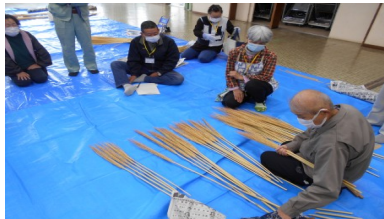
種からはじめるほうきづくり

今年度の北公民館主催事業は、各講座が無事に終了しました。来年度も様々な講座を企画する予定です。どうぞお楽しみに！