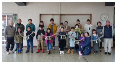
週末親子チャレンジ