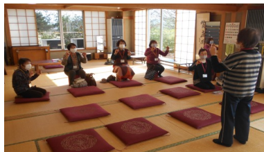
いなほふれあい学級