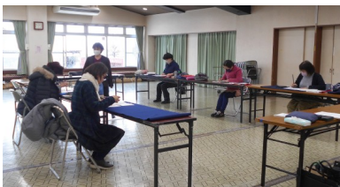
アクションレディース