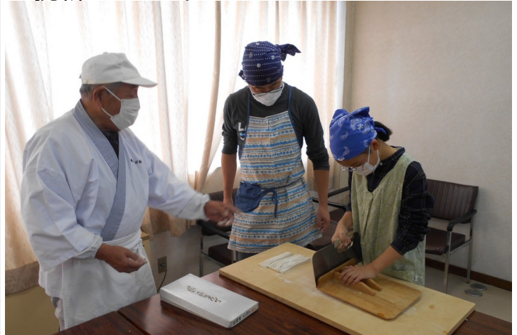
高野町そば会さんの指導で上手にできました。

主催事業『週末親子チャレンジ』が 終了しました。 地域の方が講師となり、親子で体験活動に 挑戦しました。