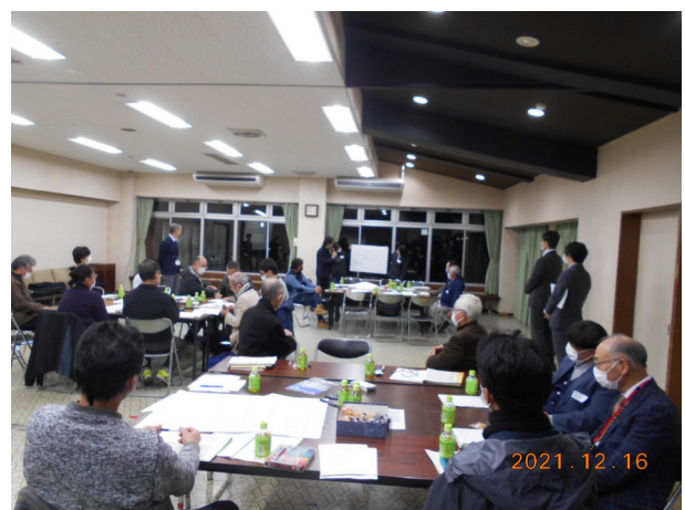
第3回「取組みたい（やりたい）事業」を考えました。