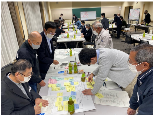
第2回「地域に残したいもの」などを考えました。

第2回は地域のことを整理して、「あったらいいな」を考え、第3回は専門部会を立ち上げました。「コミュニケーション部会」「福祉部会」「子育て部会」です。