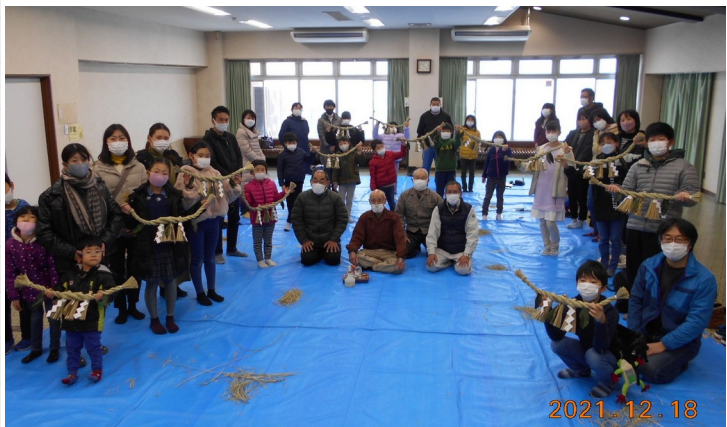
地区に伝わる伝統工芸「しめ縄」を作りました。