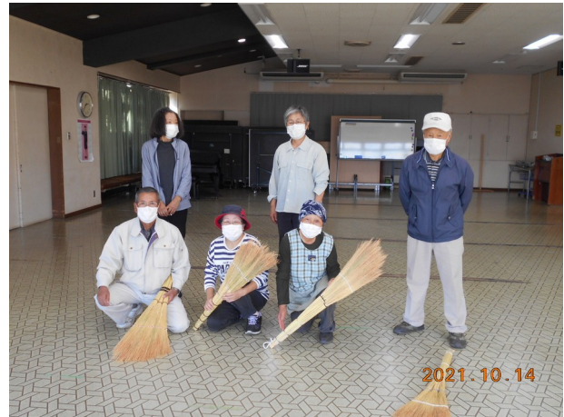
今年も傑作が出来上がりました。