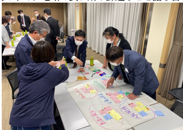
①地区の課題や資源を見つけます。

10月21日(木)に永和地区地域づくり協議会主催の「第1回永和地区まちづくりワークショップ」をアピオスペースで開催しました。 地域の皆さん33名が参加し、「永和地区地域づくりビジョン」の作成に向けて、和やかな雰囲気の中で、地域の良い所や課題などを話し合いました。