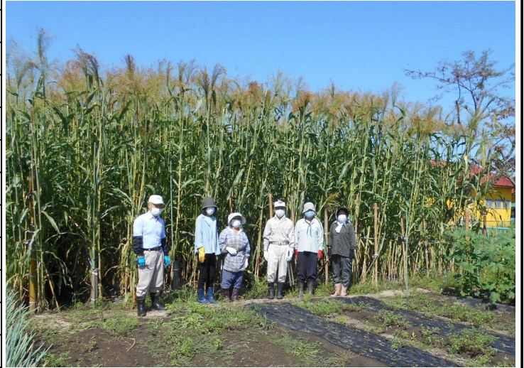
背丈の2倍に伸びた材料となる「ほうきもろこし」

北公民館の主催事業の「種からはじめるほうきづくり」の講座が終了しました。 今も地区に伝わる素晴らしい伝統技術です。