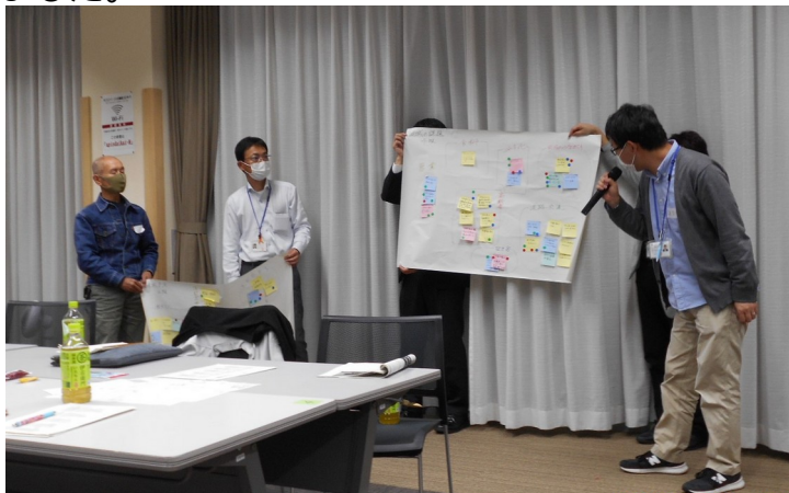
②グループごとに発表しました。