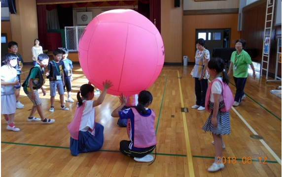
キンボールで活動をする児童たち