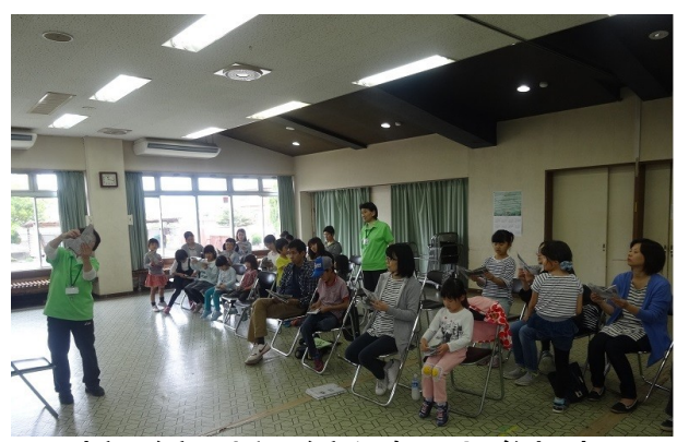
新聞紙の折り紙を楽しむ参加者

◎5月19日(土) 午前9時15分～ 北公民館 親子ふれあい広場の開講式が行われ、10組27名の参加者が集まりました。開講式後は、会津スポーツ・レクリエーション協会の指導者による会津若松市民体操、新聞紙ドーム遊び、新聞紙の折り紙などの体験をし、有意義な時間を過ごしていました。