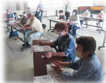
画面を確認しながら 説明を聞きます