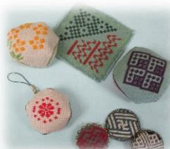
見本のようになれるかな…