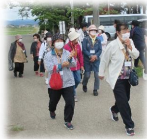
ウォーキング開始

とても分かりやすい説明で楽しく学ぶことが できた～と受講生の声。 2回目以降も、河東のいいところを再認識 できればと思います。