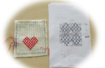
あれ?可愛いハート模様にな…