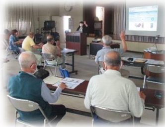
スマホの基本を学びます

6月17日(金)に第1回目がスタートしました！ 1回目の講座は、「スマホの基本」を学びました。 講師は、株式会社 エヌ・エス・シー 様 全4回 自分のスマホは「Android」？「iPhone」？ ホーム画面とは…ステータスバーとは…？ アカウント・ID・パスワードの管理、Wi-Fiの接続 詐欺の手口等、分かりやすく丁寧な説明でした。 講座終了後には、積極的に質問している受講生 も！聞きたいことは沢山あるようです。