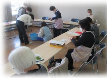
藤工芸教室の様子

公民館主催事業の先陣を切って、 5月18日(水)に第1回目がスタートしました! 開講式後に「手芸」・「太極拳」・「書道」 ・「ストレッチ」・「藤工芸」の5教室が、 専門の講師の指導によりそれぞれ開始。 受講生のスキルに応じた親切・丁寧な指導。 5月～12月までの月1回の開催となります。