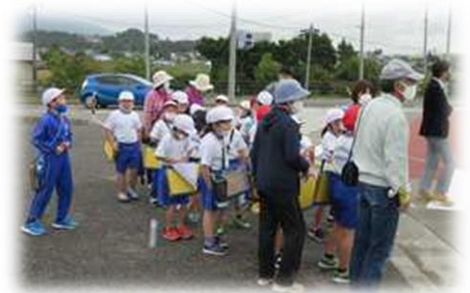
元気な子どもたちとともに 「町たんけん」へ出発！