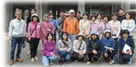
「町たんけん」に協力いただいた 地域の方