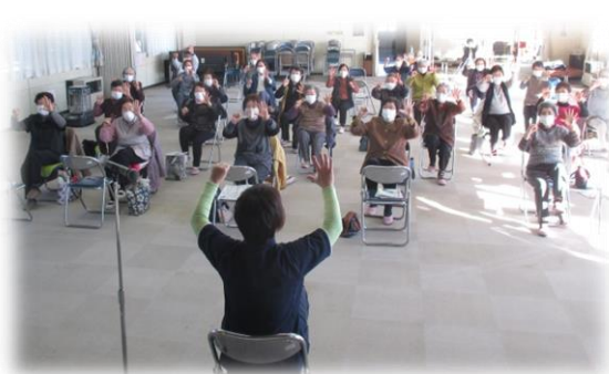
上) グーとパーを交互に出します… むずかしい〜 下) 両腕をあげて深呼吸 吸って〜吐いて〜万歳〜

今後、2月までの毎月1回、軽い運動を中心に開催しますので、動きやすい服装でお越しください!