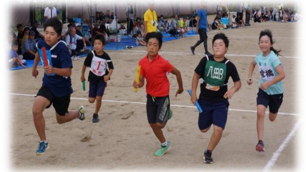
運動会といえは... やほりこの種目です! 『男女混合地区対抗リレー』 (第1位: 高塚地区 3分53秒04)