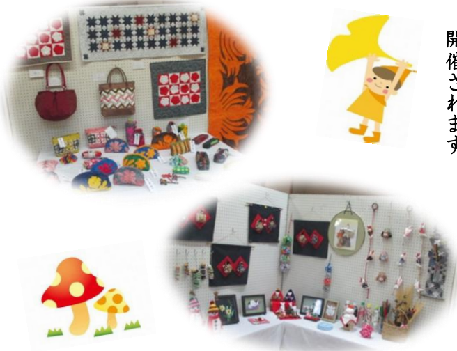
地域の皆さんの力作が並びます (昨年の様子)