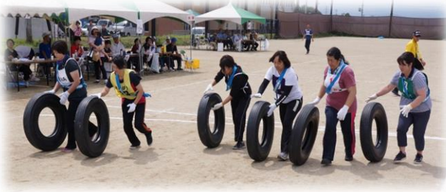
スピードの出しすぎに注意! 『交通安全運転』 (第1位: 岡田地区 4分36秒06)

選手・応援の皆さんは、地区の勝利を目指して、趣向を凝らした15競技に熱戦を繰り広げました。