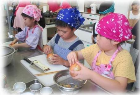
「食生活改善推進協議会第5班」の皆さんと、チキンカレーを作りました。

『夏休み移動教室』は、7月26日・7月30日・8月1日・8月9日・8月22日の5日間、公民館において開催しました。 1年生から6年生まで約27名の児童が参加し、料理体験や施設見学・歴史たんけん等、公民館利用団体の皆様のご協力をいただきながら、夏休みならではの活動を通して楽しい時間を過ごしました。