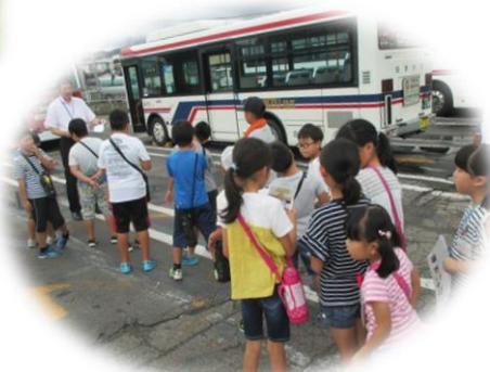
バス乗り体験では、実際にいろいろなバスに乗ってきました! バスの洗車体験が人気でした。