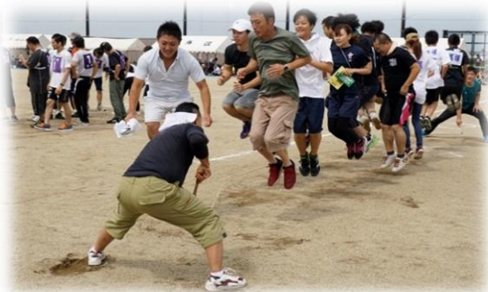
心ひとつに... 『みんなでジャンプ』 (第1位: 高塚地区 32回)