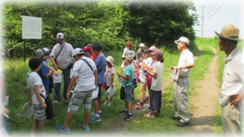
「会津河東史談会」の皆さんと 八田野一里塚にて!