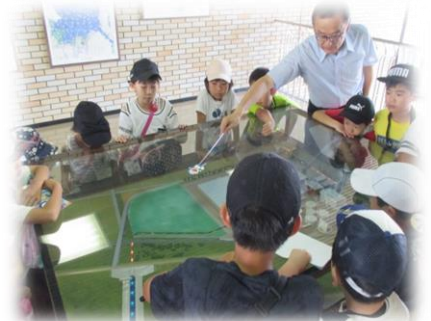
施設見学では、 下水浄化工場へ行ってきました!