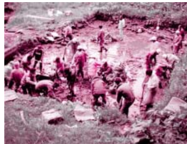
ボランティアによるお濠の浄化作業