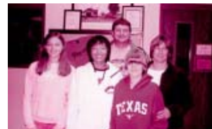
外国の文化にふれる