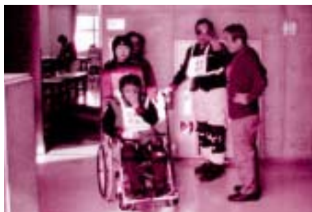
誰もが安心して生活できる社会を