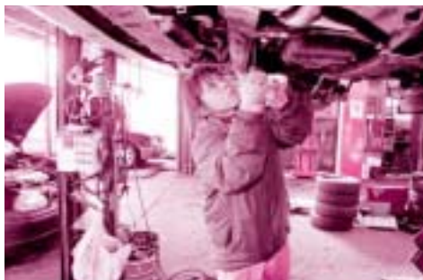
自分らしく生きられる社会を