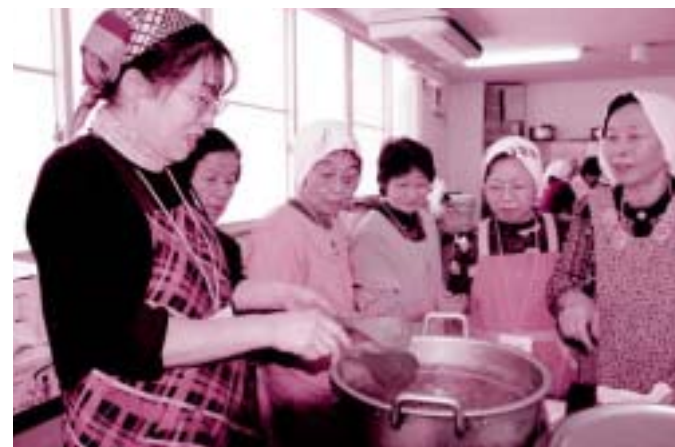
地域のふれあいが素敵なまちをつくる