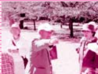
おちてなしの心で