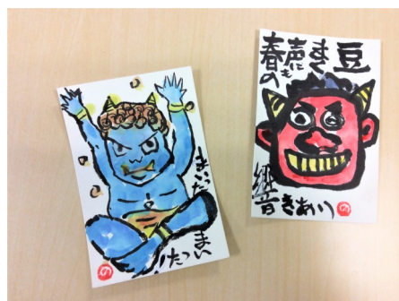
(C-2) 佐藤 典子 作品例