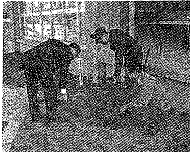
▲会津若松郵便局では、簡易保険加入者の会創立50周年を記念して10月31日会津図書館前にサツキの苗木10本を贈りました。来春は来館する人々の目を楽しませることでしょう。