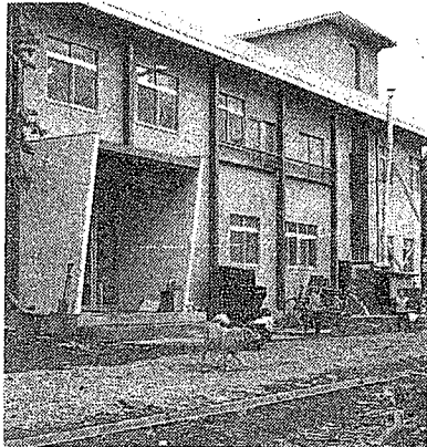
▲会津児童園では、市内大戸町小谷に宿舎を新築中でしたがこのほど完成、三日移転しました。暖い人々の善意で建てられ、子供たちも大喜びです。