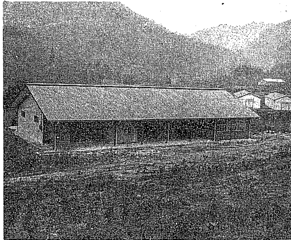
りっぱに完成した共同飼育所