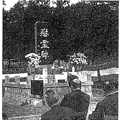
▲満州開拓に従事し、わびしく異郷に散った方々の慰霊碑が、生き残った人々の手によって小田山忠霊堂地内に建立され、その除幕式が4日午前10時に行なわれました。