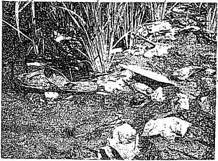
⑤水田の中にまで入ったゴミ。（八日町）