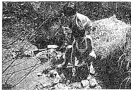
②きたない川で遊ぶ子供たち。(城北小下流)

猪苗代湖のきれいな水が飯盛山の洞穴をくぐり、観光客の前に姿を見せる。観光客が思わず手を洗ったり、タオルをぬらして汗をぬぐうほど、きれいな水なのである。 しかしこのきれいな水も、市内に入ったとたん悪臭とゴミの山に一変する。そして多くの人々に被害を与えている。観光都市会津若松としては、無視できない現実だ。そこでこの現実を写真で特集し、みんな考えてみようと思う。川本来のきれいな清らかな流れを、よびもどすために。