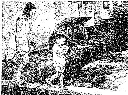
④下町の人々はゴミに囲まれて生活している（城北小わき）