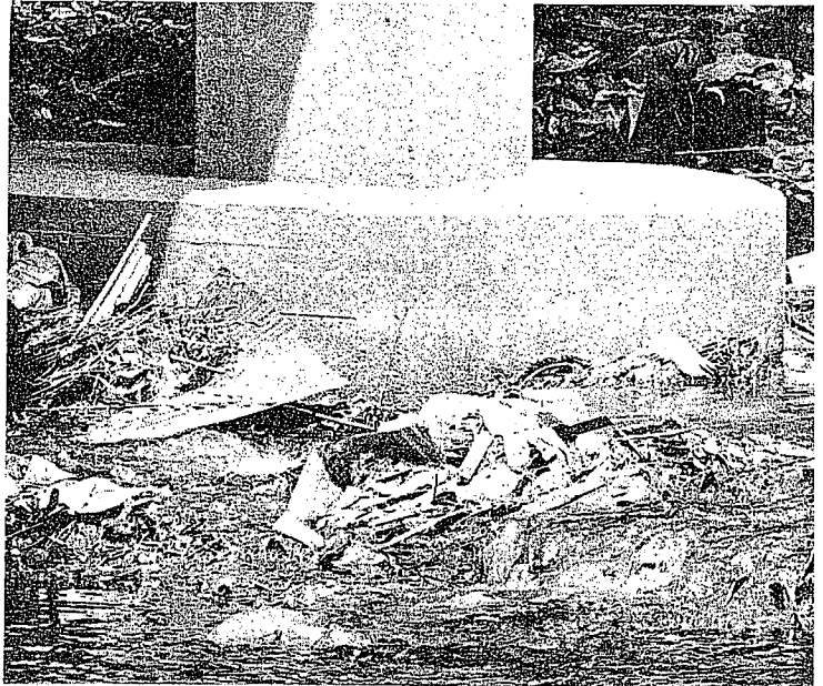
⑥新横町の鳥橋下の現状