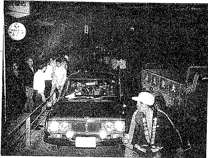
6月4日門田町の火災現場付近につめかけたヤジ馬・ヤジ車 消火活動に大きなさまたげとなりました