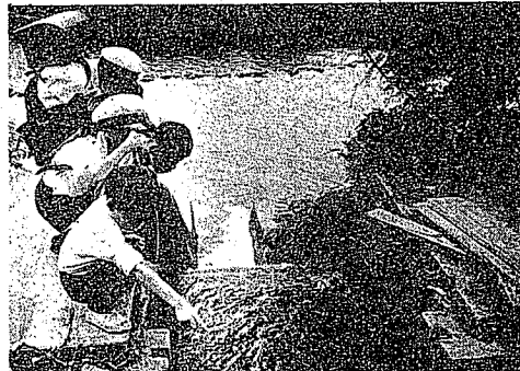
親の注意がほしい子どもの水遊び

が目を離していたことにも大いに原因があるわけですから、このような悲しい事故をくり返さないようにするには大人の注意が第一ではないでしょうか。