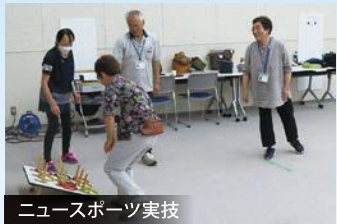
ニューススポーツ実技