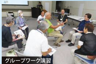
グループワーク演習