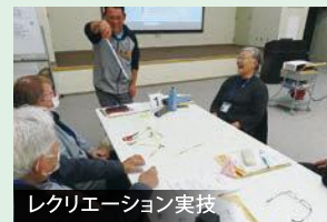
レクリエーション実技