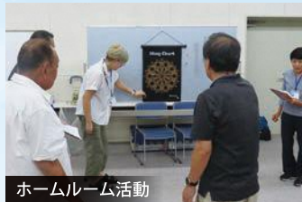
ホームルーム活動