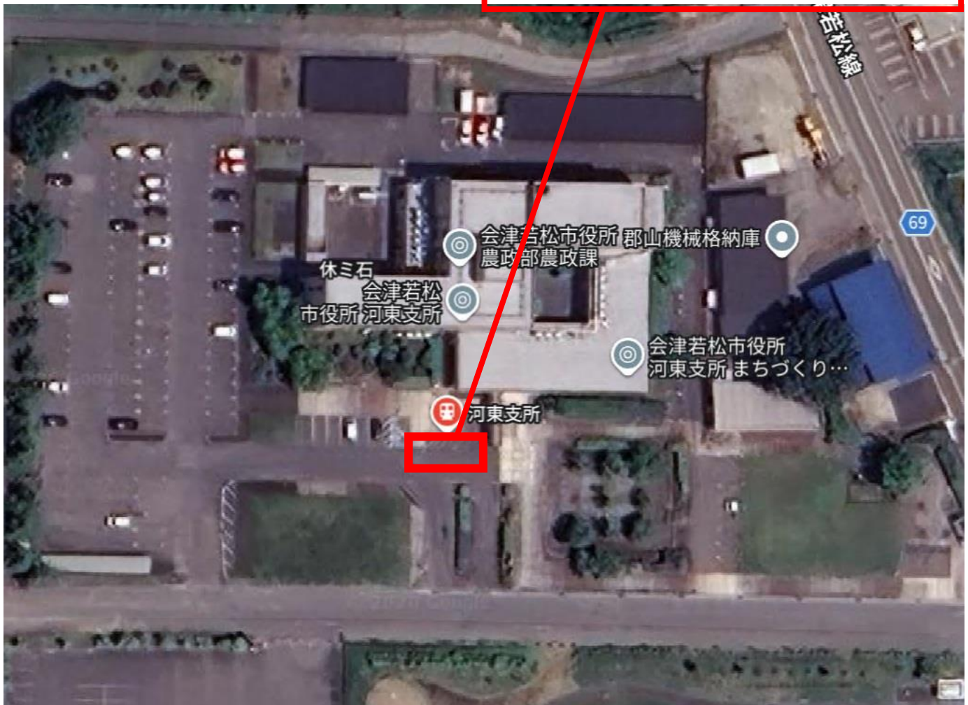
河東支所乗降場所（バス停）