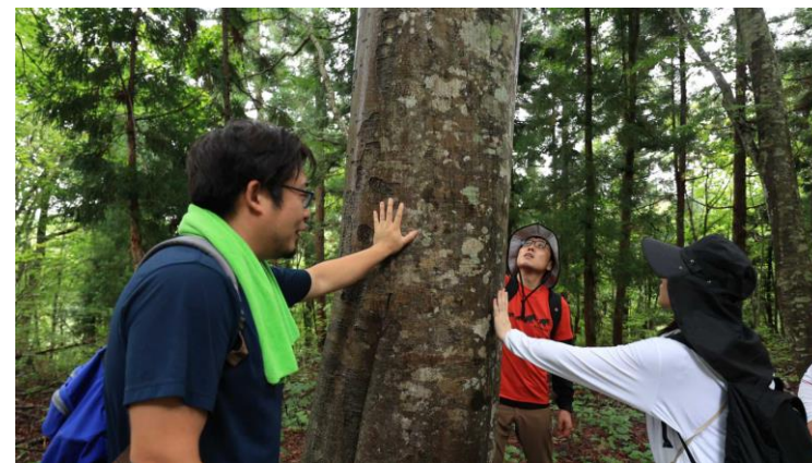
「癒しの森」山菜採りトレッキング 【只見町】