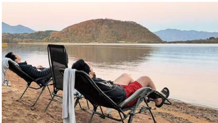
猪苗代湖畔でテントサウナ 【会津若松市】