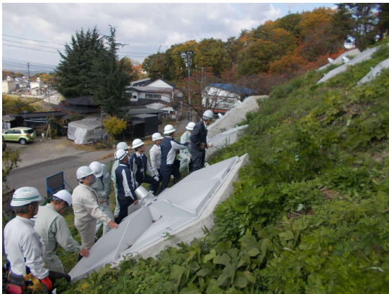
令和6年度工事の確認状況