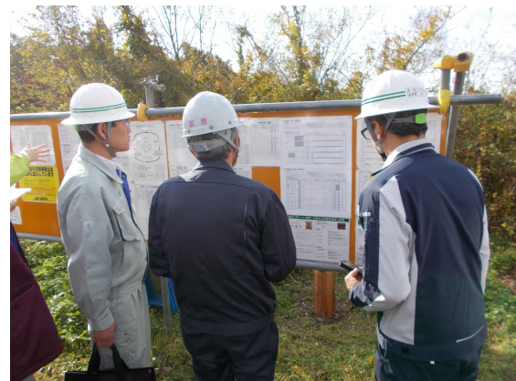
現場標識類の掲示状況