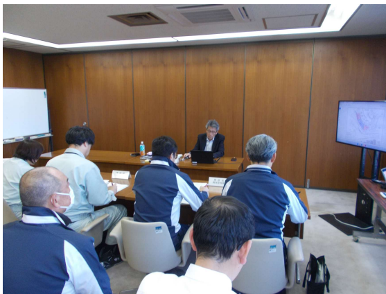
技術士による所見・講評