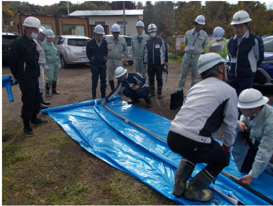
アンカー材の確認状況