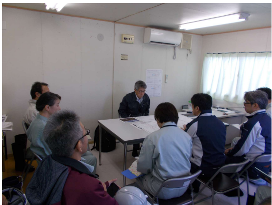
工事概要説明状況