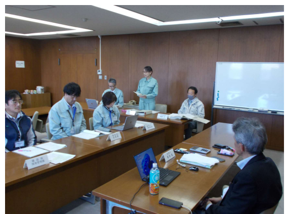
監査委員閉会あいさつ