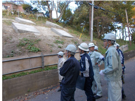
令和7年度工事の確認状況