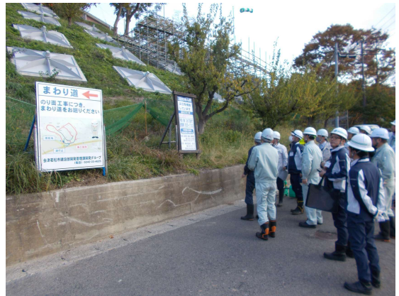
工事現場内での質疑応答状況