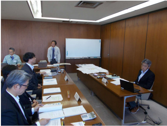
代表監査委員あいさつ