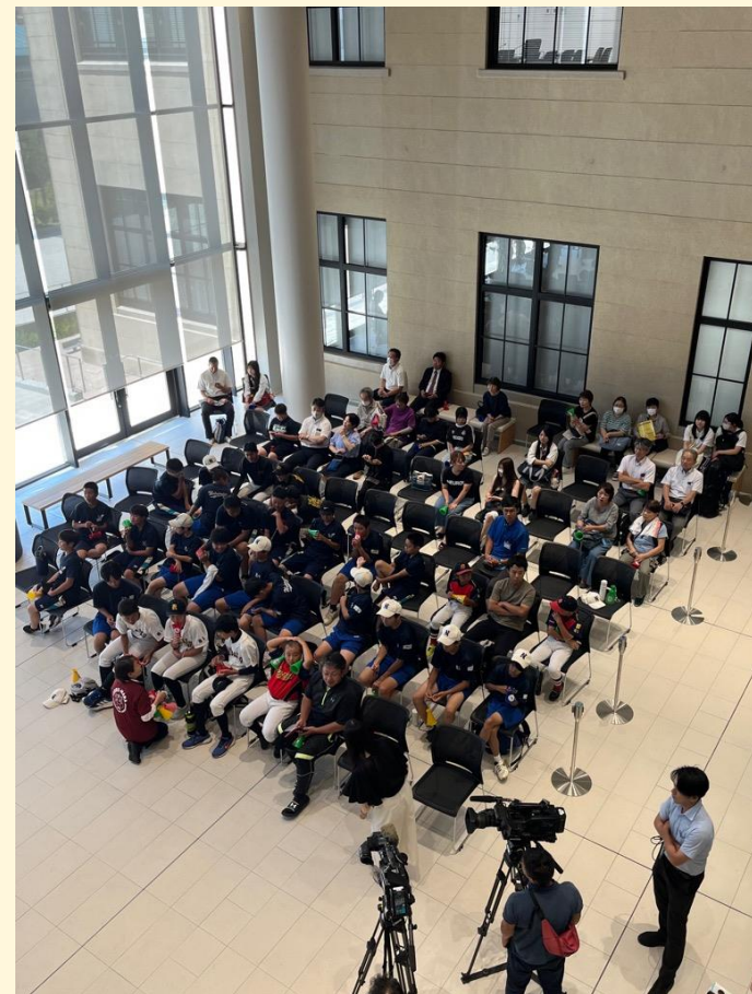
【イベント】 全国高等学校野球選手権 福島県大会決勝戦の 応援会