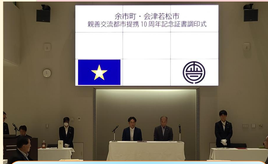
【式典】 余市町親善交流都市提携 10周年記念証書調印式