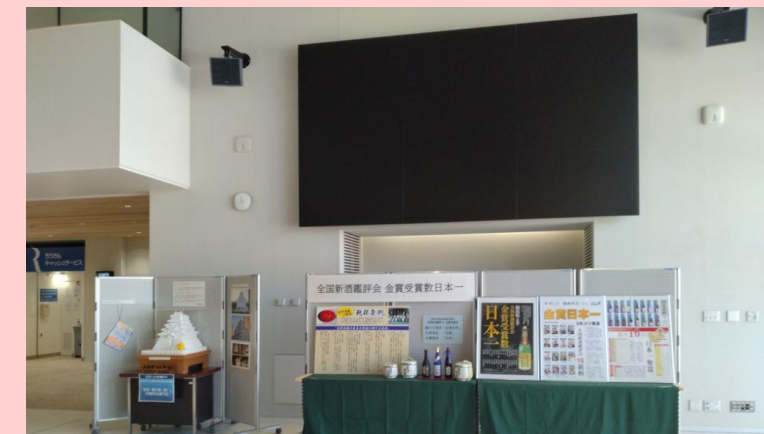
【展示】 さっぽろ雪まつり大雪像模型展示 全国新酒鑑評会受賞PR