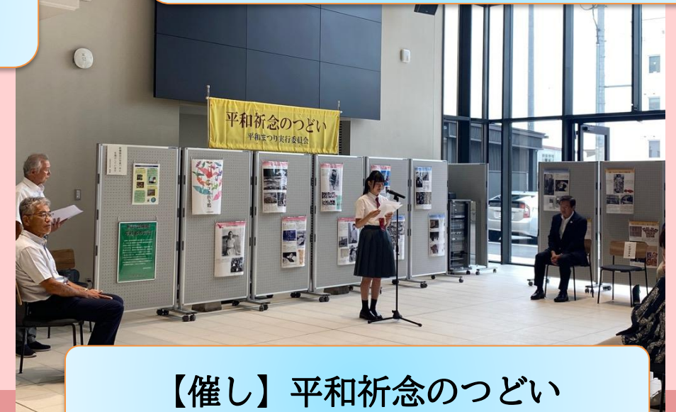
【催し】 平和祈念のつどい