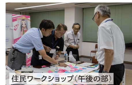
住民ワークショップ(午後の部)