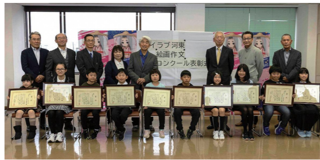
10月26日、河東支所で表彰式を開催しました

ぼくが河東町のすきな所は、たくさん虫が住める自然がのこっていることです。たくさん虫たちをずっとずっと住めるようにしてあげたいです。特にホタルが大すきなです。ずっと続いてほしいきれいな光景です。