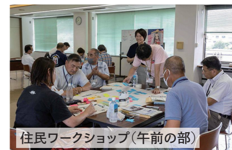
住民ワークショップ(午前の部)