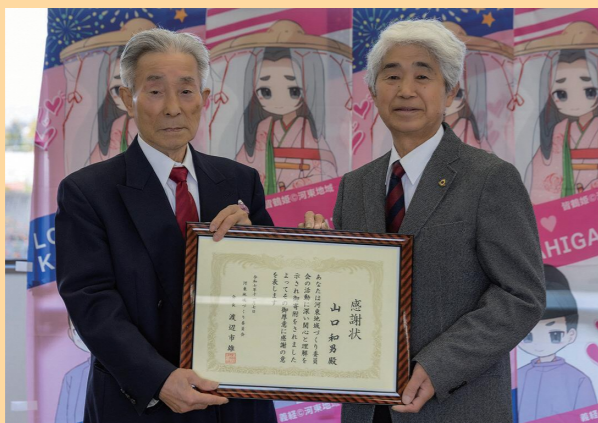
感謝状と記念品をお渡ししました

河東地域づくり委員会では、皆さんの温かい寄付をお待ちしています。河東地域の活性化のために活用いたします。