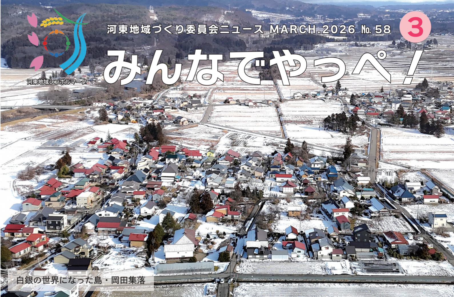
白銀の世界になった島・岡田集落