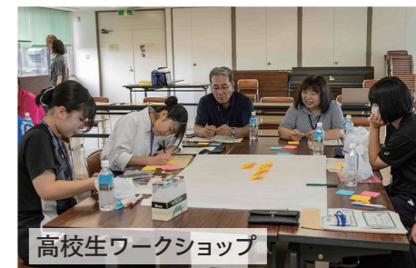
高校生ワークショップ