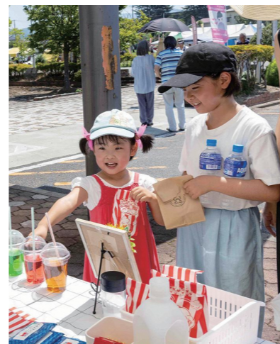
楽しい催しを開催します

(仮称) こども未来部会 ▼分野別目標…●地域みんなで育み、こどもの笑顔が輝くまちづくり ▼活動の柱…●河東地域フライン大作戦など親子で参加できる環境美化と保全活動(継続・発展) ●子どもといっしょに交流できる場の創出 ●河東支所の学習・交流スペースなどを活用した子どもの居場所づくり