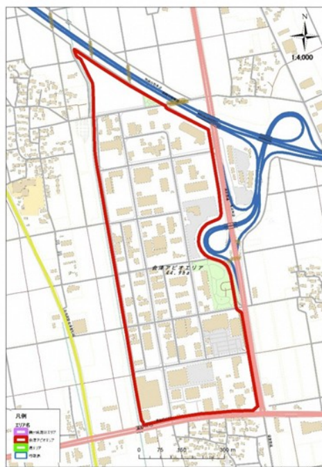
【会津アピオエリア】