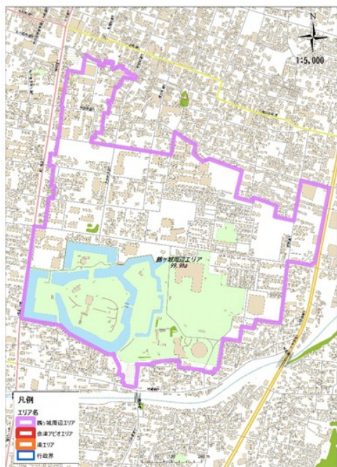
【鶴ヶ城周辺エリア】