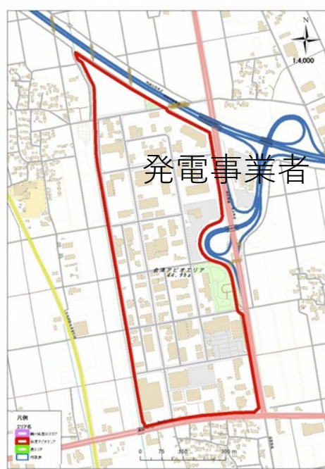
【会津アピオエリア】