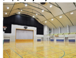
フィットネスルーム