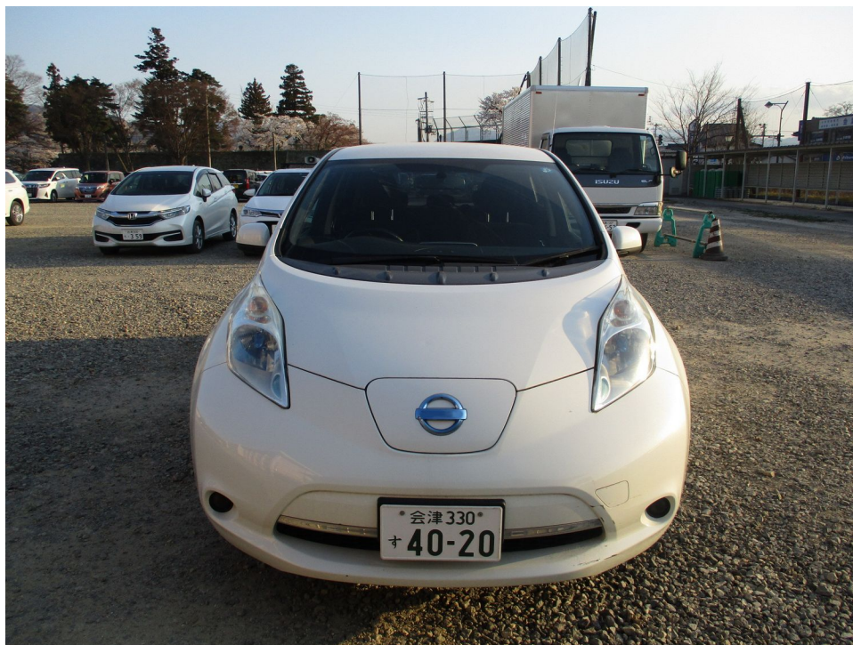
(撮影年月日 令和 5年 4月 3日)