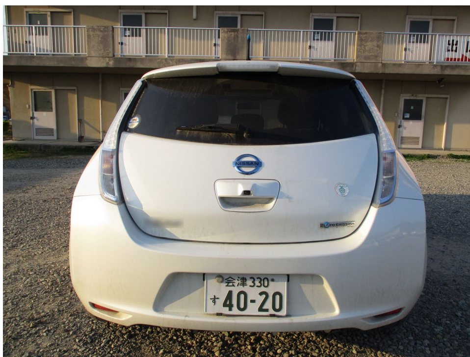
(撮影年月日 令和 5年 4月 3日)