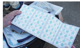
つなポンをこんなにためたよ