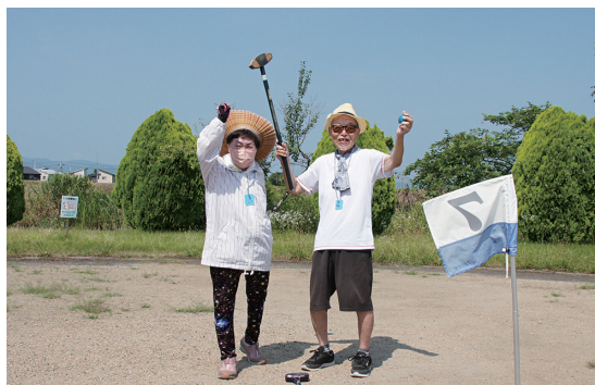
ホールインワンを決めてガッツポーズ!