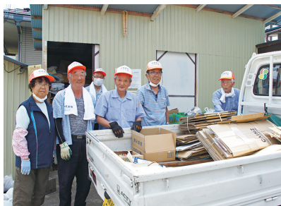
今回はこれだけの古紙を回収できました。

「長年続けてきた仕事を退職して時間がある」、「体力をいかして社会に役立つことをしたい」、「友人をつくりたい」。そのような方は、活動を通して、自分の「居場所」と「役割」を見つけ、生きがいづくりをしてみませんか。