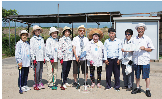
緑寿会の皆さん。90代も元気で楽しくプレー!