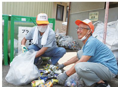
種類が異なる缶が混在していないか確認することも重要な仕事です。