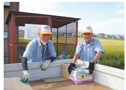
町内の隅々をめぐって回収しています。