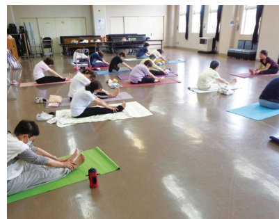
ヨガ教室 (わたし塾)