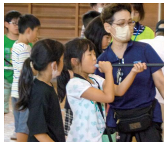
吹き矢にちょうせん (まつながっ子1455)

▽申込書は松長小学校を通して配布します。松長小学校以外の小学生でも登録できますので、一箕公民館までお問い合わせください。