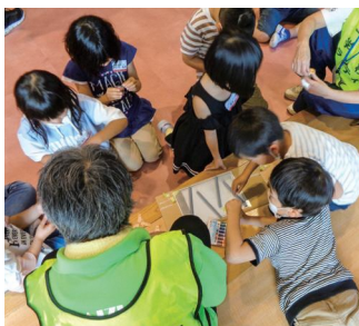
ピコピコカプセル (まつながっ子1455)