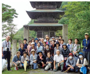
秋の歴史探訪 (一箕シルバー大学)