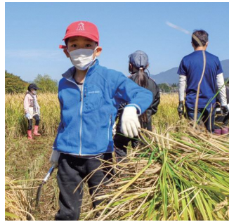
稲刈り体験 (げんき塾)

▽申込書はその都度、一箕小学校、松長小学校を通して配布します。それ以外の子どもでも参加できますので、一箕公民館までお問い合わせください。