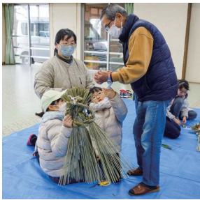
今年自作のしめ縄を飾りましょうね (週末親子チャレンジ)