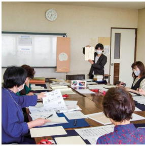
筆ペンで「書に触れる」ひととき (旧アクションレディース)