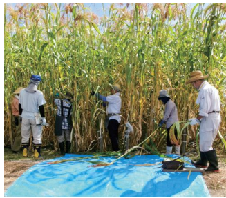
4mを超えるほうきもろこし (種からはじめるほうきづくり)