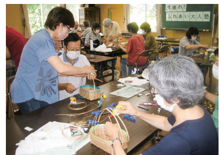
クラフト体験（顔晴れ！ふれあい大人塾）