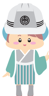
ヘルメット付きココがポイント