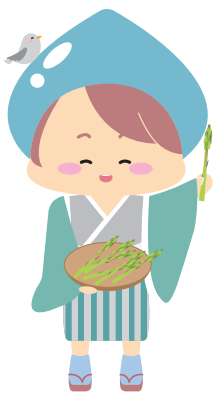
春 (アスパラガスとカッコウ)