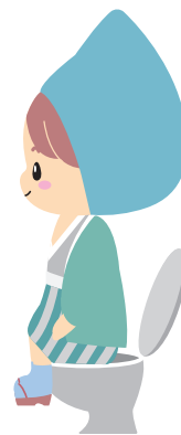
座る(トイレ) (*こしえるん単体で使用も○)