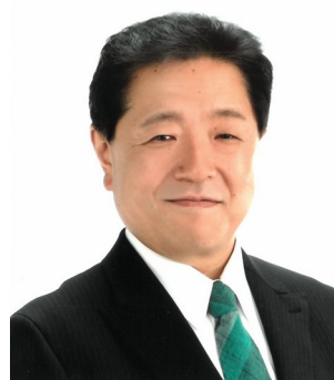
第 61 代議長