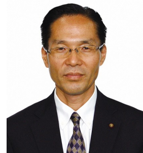
第 67 代副議長