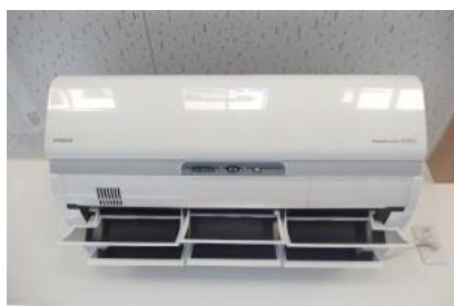
冷暖房はエアコンにて