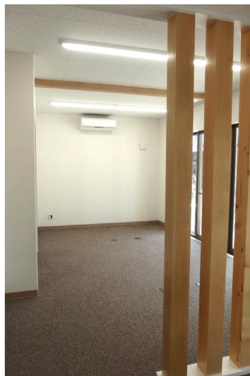
[ 交流スペース (18.22 m 2 ) ]