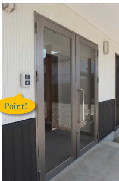
←入退館は IC カードで管理