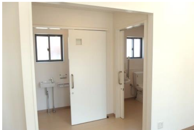
男女別のトイレ (右側は車いす対応)