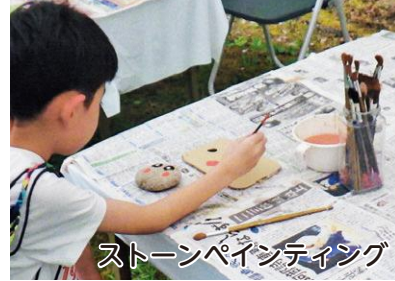
ストーンペインティング