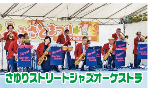
さけりストリートジャズオーケストラ