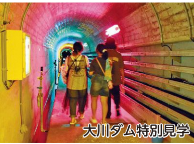
大川ダム特別見学