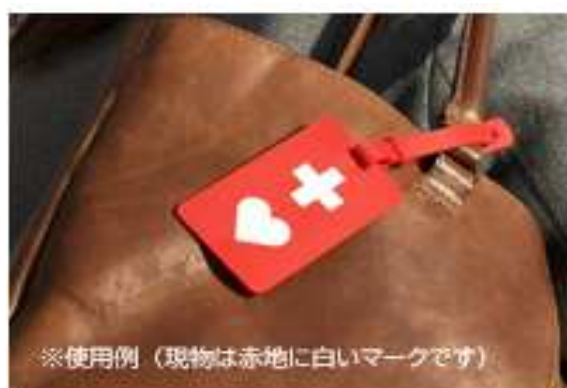
※使用例（現物は赤地に白いマークです）