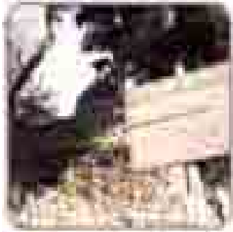
日新館天文台あと