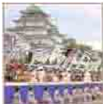
はん公行列の出発式の様子