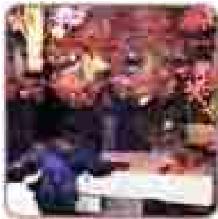
会津春まつり(さくらまつり)