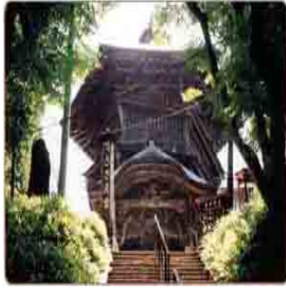
いいもり山にあるさざえ堂