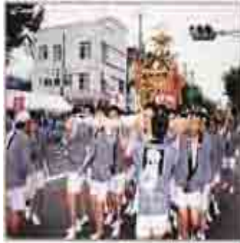
夏まつりおみこし