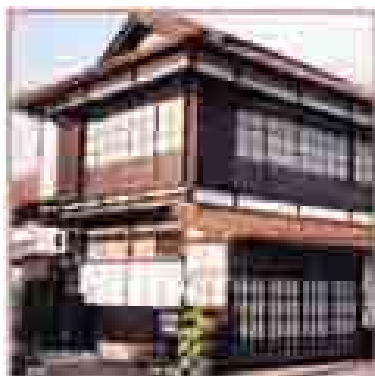
むかしからある店