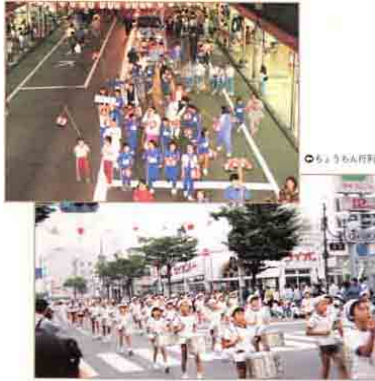
ちょうちん行列・こてきパレード ホタル祭り

みんなは、それらのまつりや行事、そのいわれについてしらべてみることにしました。しらべてみて、みんなは、まつりや行事には地いきの人びとのいろいろなねがいや楽しみがこめられていることに気づきました。