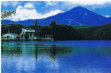
猪苗代湖の取水口(しゅすいこう)