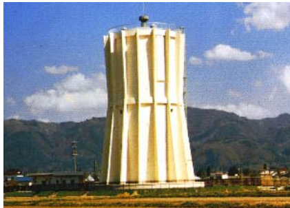
北会津じゅ水とう