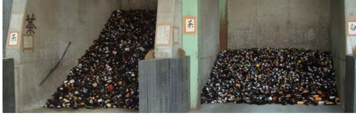
あつめられたあきびんの山