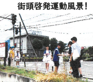
街頭啓発運動風景!