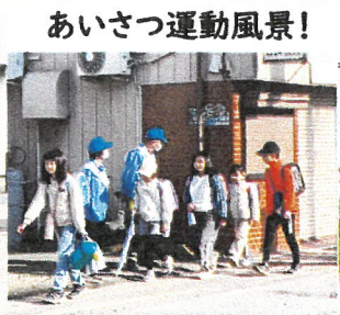
あいさつ運動風景!