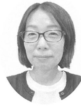
神指地区青少年育成推進協議会