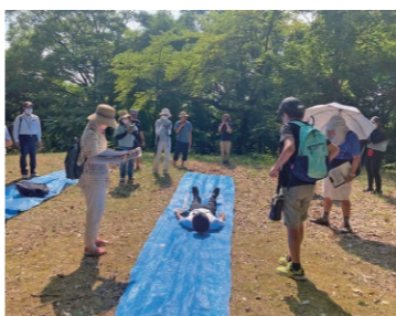
昨年度は、古墳に埋葬された棺の様子を再現しました

▼定員：20人程度 ▼申し込み方法：◎所定の申込書に必要事項を記入し、直接か郵送、ファクスで協働・男女参画室(〒965-1860 1 ※住所不要 FAX 39-1400)へ提出◎電話で申し込み※申込書は市のホームページから取得も可 ▼締め切り：5月22日(水) ▼その他：託児、手話通訳あり※要申し込み ◇問い合わせ：協働・男女参画室(☎39-1405)