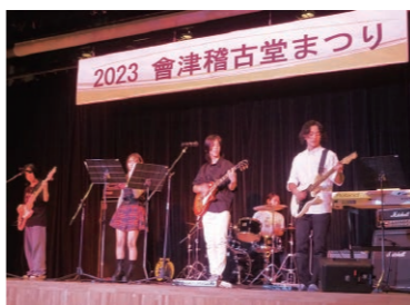
ステージ発表や作品の展示などをしてみませんか