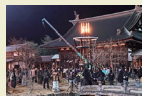
會津藩校日新館での撮影の様子