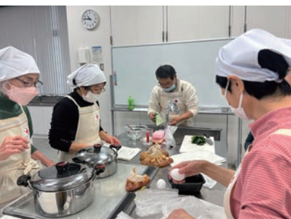
非常食作り訓練の様子