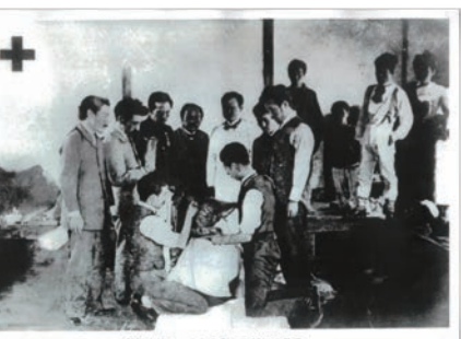
磐梯山大噴火での救護活動