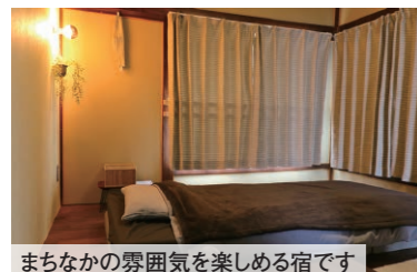
まちなかの雰囲気を楽しめる宿です

最近、徒歩や自転車で市内に観光するお客様が多いと感じています。そういったお客様に、お泊りできるゲストハウスを新たに開設し、地元などに新しい観光の活性化に繋がっていききたいですね。