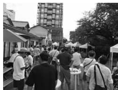
各種イベントの開催