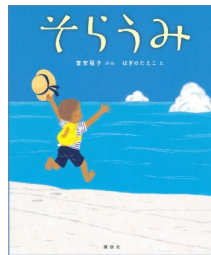
『そらうみ』 富安 陽子 // ぶん はぎの たえこ // え 講談社