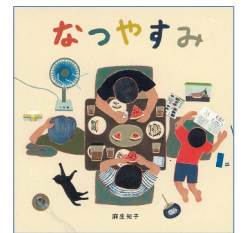
『なつやすみ』 麻生 知子 // 作 福音館書店