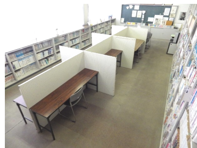
学習スペースの様子