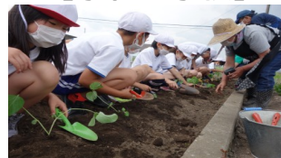
3年生の「地域野菜」栽培。地域の農家の方に教えていただきながら、「かおり枝豆」の苗を植えました。