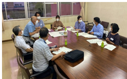
部会に分かれて話し合いました。

次回テーマは『これからの地域像を描こう！～全体のまとめ～』です。地域のことを一緒に考え、自由に話し合ってみませんか。当日の飛び入り参加も大歓迎です！