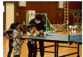
卓球を教えてもらっています。