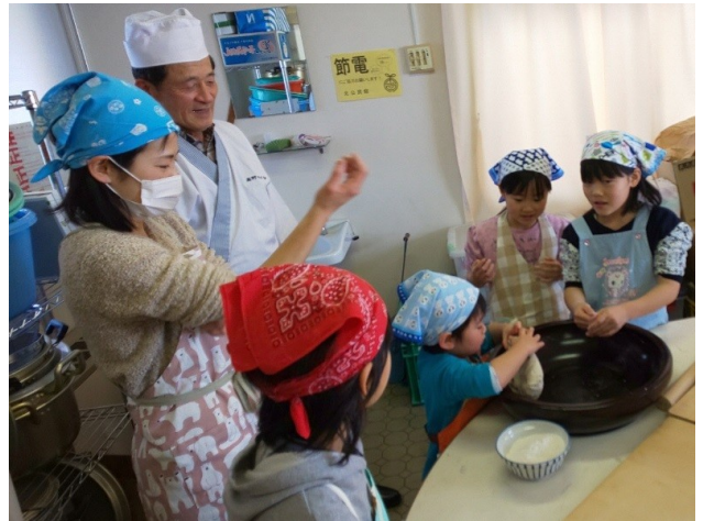
そば粉を一生懸命こねる参加者